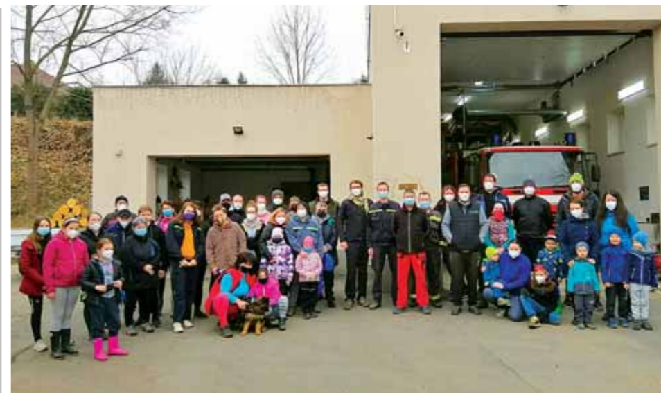
V sobotu 27. března jsme se připojili k celorepublikové akci Uklidme Česko. Dobrovolníci si ráno u hasičské zbrojnice vyzvedli pytle na odpadky, svačiny, rukavice i roušky a vydali se za úklidem. Všem účastníkům děkujeme!

V pondělí 15. března začala v ulicích Sportovní, Lipová a Na Place společnost ČEZ Distribuce a.s. rekonstruovat nadzemní elektrické vedení. Nově povedou kabely zemí, takže uliční prostor nebudou hyzdit betonové sloupy, kabely ani nástřešáky. Po elektrikářích nastoupí silničáři – firma STRABAG provede kompletní opravu asfaltových komunikací ve všech třech ulicích a ve Sportovní opraví také chodník pro pěší. Na závěr se obnoví veřejné osvětlení, které elektrikáři při rekonstrukci dočasně odstraní. Nadzemní vedení se bude ukládat do země také v ulicích Strmá, V Chaloupkách, Pavlíkova a Na Hrázi. Jejich obyvatelé se nových asfaltových komunikací dočkají v následujících letech.