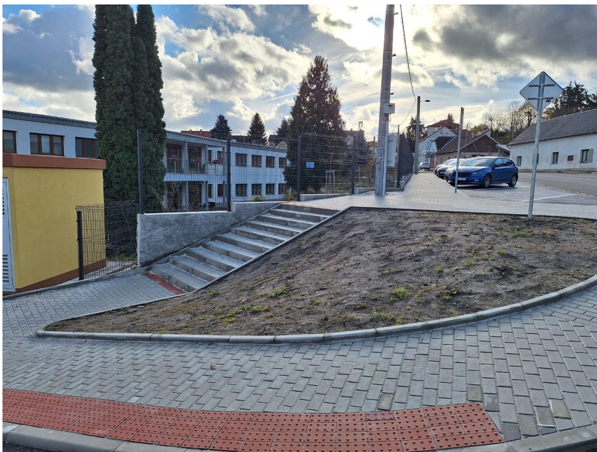
Chodník v Pražské ulici