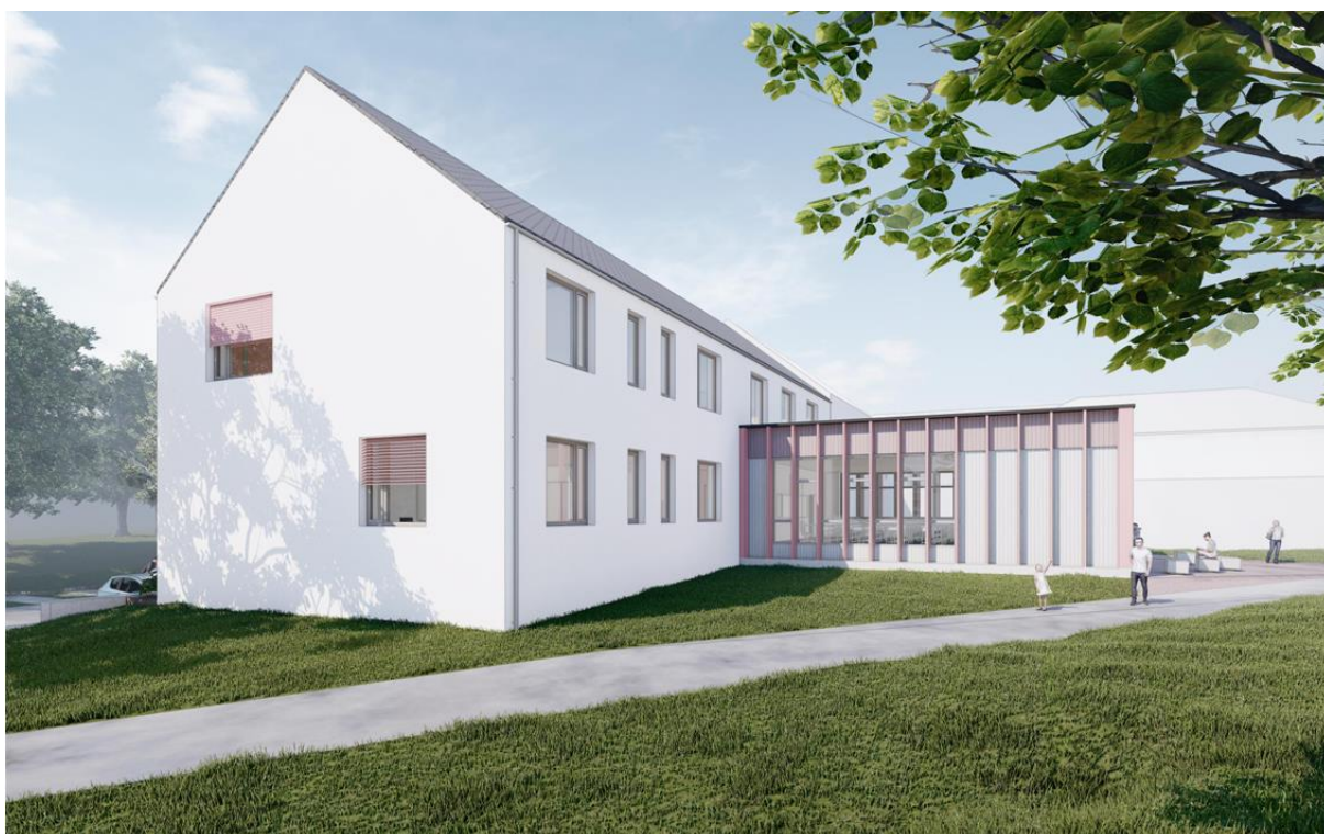
Architektonická studie rozšíření ZŠ