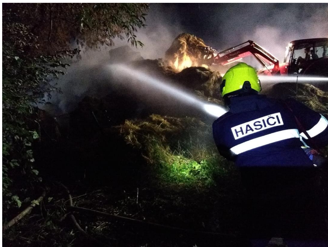
JPO Poříčí nad Sázavou