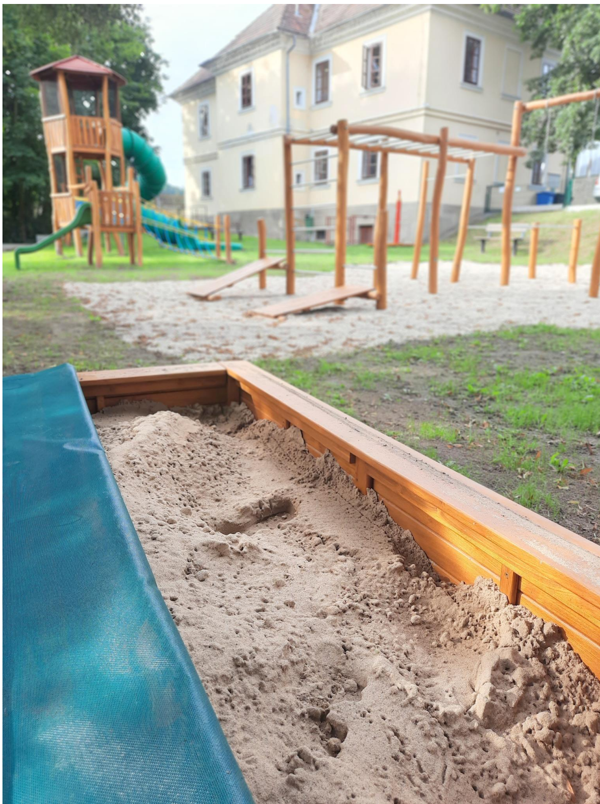
Dětské hřiště u obecního úřadu