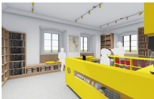
Architektonická studie – knihovna a infocentrum