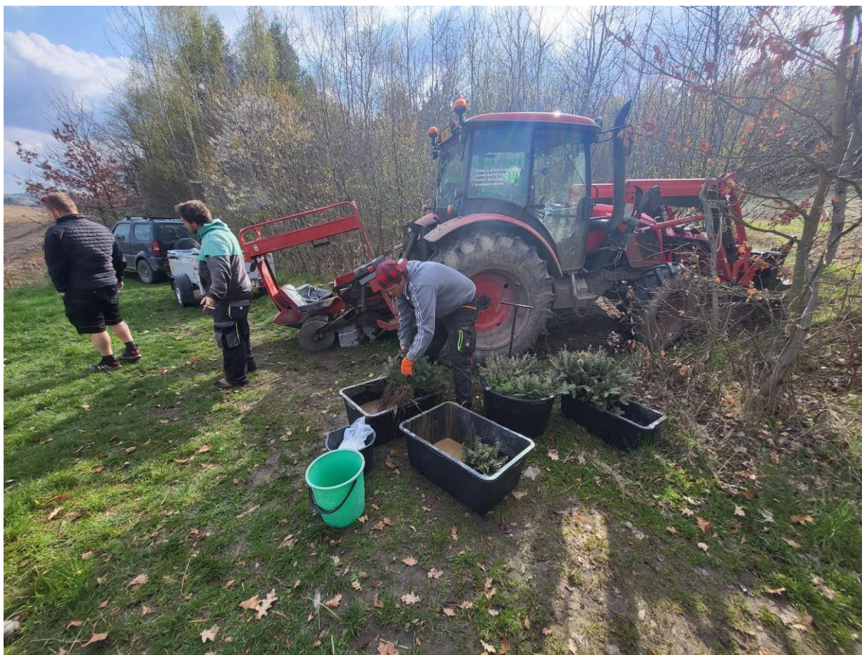
Lesní práce ve svárovském lese